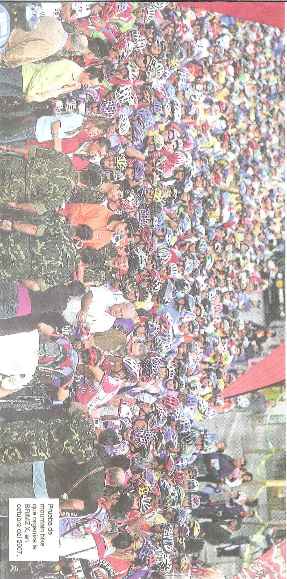
Prueba de mountain bike que organiza la BRIMZ X, en octubre del 2007.