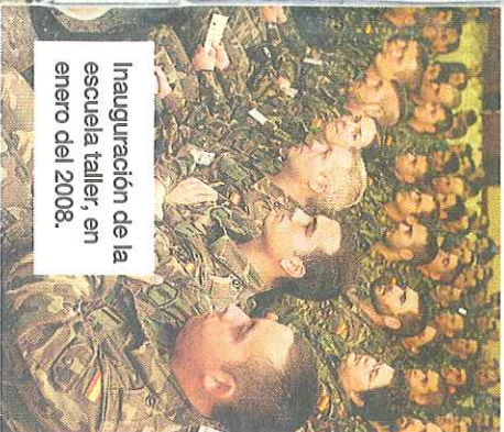
Inauguración de la escuela taller, en enero del 2008.