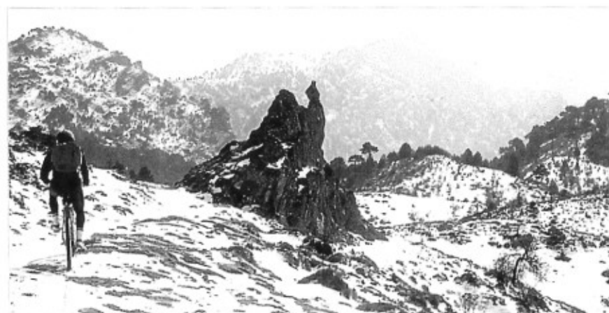
Collado de los Frailes