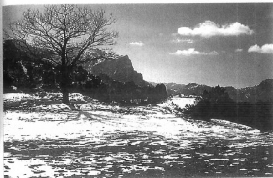
Cortijo de los Alguaciles

En la ascensión no encontraremos ninguna bifurcación importante hasta el cruce con la pista de la casa forestal de la Fuente del Roble . En este cruce, nuestro cuenta-kilómetros marca 9'150 km desde el comienzo de la ruta. Poco antes del cruce, habremos visto a la izquierda, entre encinas y algún ejemplar joven de roble, la fuentes del Roble , con abrevaderos para el ganado; también,