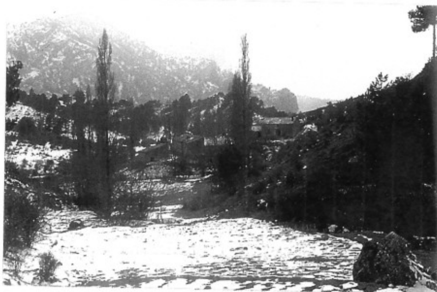
Hoya de Albardía

En la travesía por la sierra de Mirabueno y el río Aguamula encontraremos una combinación única de deporte y disfrute paisajístico. La ruta discurre por un entorno salpicado de aldeas fantasma, al abrigo de los cintos, farallones y recodos de la cordillera de las Banderillas. Al conocer estos parajes, nos podremos hacer una idea de cómo fue la vida en la sierra hace años, aunque hoy en día sean tan sólo tranquilos rincones arruinados, tomados ya por la naturaleza.